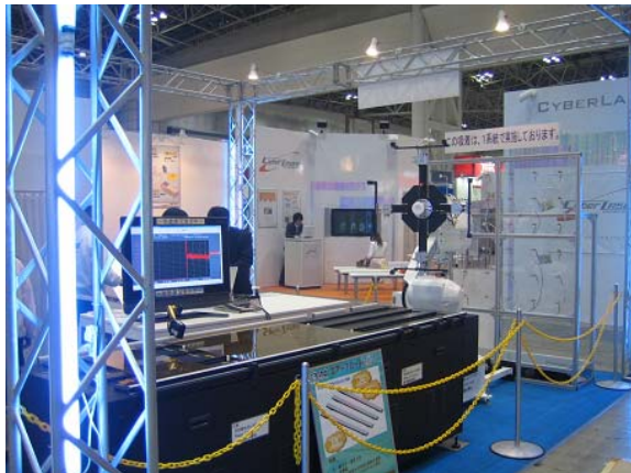
非接触ロボットハンド&新型フロートコンベア